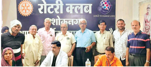
हरिभूमि न्यूज़ अशोकनगर

रविवार को रोटरी क्लब द्वारा श्री सद्गुरु सेवा ट्रस्ट नेत्र चिकित्सालय लटरी के सहयोग से निःशुल्क नेत्र शिविर का आयोजन रोटरी भवन में किया गया। इसमें काफी संख्या में मरीजों ने उपस्थित होकर जांच करवाई एवं कई मरीजों को मोतियाबिंद ऑपरेशन के लिए चिह्नित किया गया।