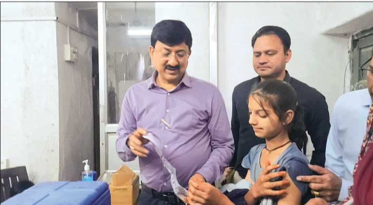
हरिभूमि न्यूज़ अशोकनगर

जिला कलेक्टर ने सामुदायिक स्वास्थ्य एचपीवी (ह्यूमन पैपिलोमा वायरस) को वैक्सीनेशन के प्रति जागरूक किया एवं स्वयं उपस्थित रहकर वैक्सीनेशन अभियान का निरीक्षण किया। इस दौरान उन्होंने उपस्थित जनसमूह को संबोधित करते हुए बताया कि यह टीका बच्चियों को भविष्य में होने वाले सर्वाइकल एवं गर्भाशय कैंसर से बचाने में महत्वपूर्ण भूमिका निभाता है। कलेक्टर ने लोगों से