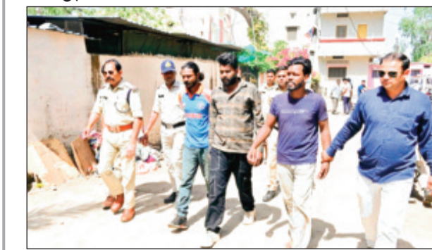
विदिशा। आरोपियों को गिरफ्तार कर पुलिस ने निकाला जुलूस।