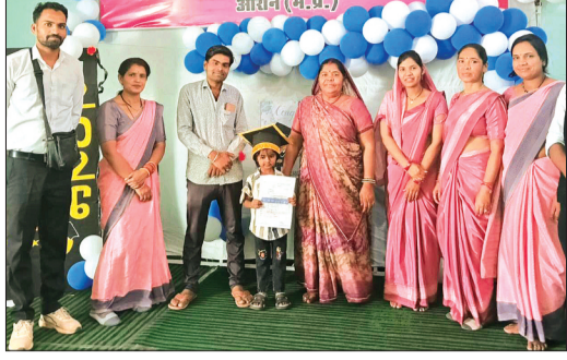
हरिभूमि न्यूज़ आरोन

आचार्य पीसीरे कॉन्वेंट स्कूल द्वारा शैक्षणिक सत्र 2025-26 का वार्षिक परीक्षा परिणाम घोषित