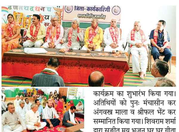
हरिभूमि न्यूज़ अशोकनगर