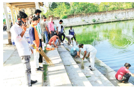
हरिभूमि न्यूज़ अशोकनगर

परमेश्वर तालाब पर जल गंगा संवर्धन अभियान के तहत तालाब एवं घाटों की सफाई कर श्रमदान किया गया। यह कार्यक्रम का द्वितीय चरण था। कार्यक्रम की अंतर्गत समस्त ग्राम विकास प्रसफुटन समितियों में जल मंदिर निःशुल्क प्याऊ जल स्रोतों की साफ सफाई, जागरूकता हेतु दीवाल लेखन, जल चैपाल आदि का कार्यक्रम आयोजित किये जा रहे हैं। इन्हीं कार्यक्रमों के अंतर्गत विकासखंड चन्देरी में विकास खण्ड समन्वयक जन अभियान परिषद् दीपक