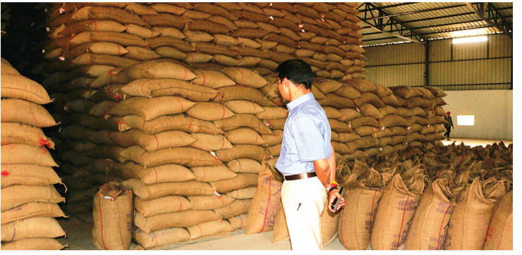
जिले में 26 खरीदी केन्द्र बनाए गए

जिले में समर्थन मूल्य पर गेहूँ की खरीदी 15 अप्रैल से निर्धारित की गई है, जो 12 मई तक चलेगी, इस खरीदी को लेकर जिले में 26 खरीदी केन्द्र बनाए गए हैं लेकिन इन केन्द्रों में कई केन्द्रों पर गत वर्ष भी भारी अनियमितारं मिली थी, शिकायतें हुईं जांच भी हुई लेकिन आज तक कोई कार्यवाही नहीं हुई। मजदूर बात यह है कि जिन केन्द्रों पर अनियमितारं मिली थी उन केन्द्रों को फिर से खरीदी केन्द्र बनाया गया है। यह अनियमितारं मसूर, चना और अन्य खरीदी में मिली थीं।